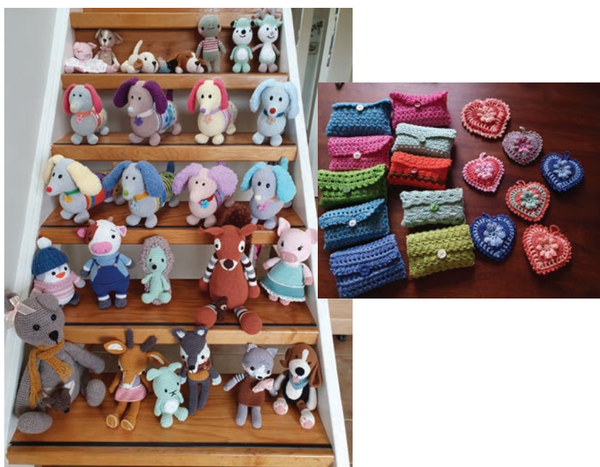
Giften van particulieren