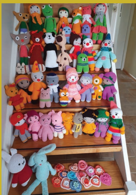
Gift Breiclub Heerewaarden